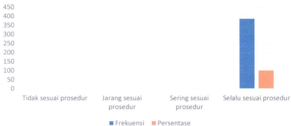
Indeks pada indikator Manipulasi Peraturan