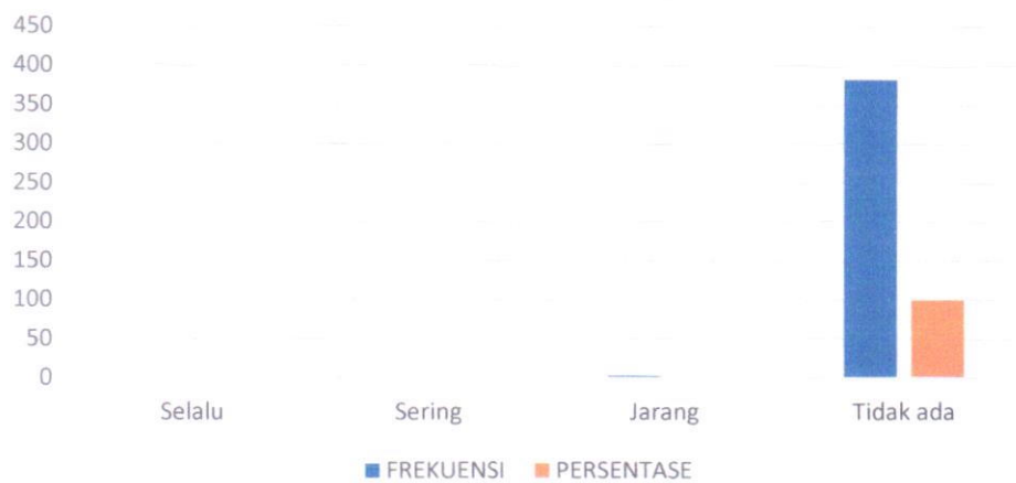
Tabel indeks pada indikator Transaksi Rahasia