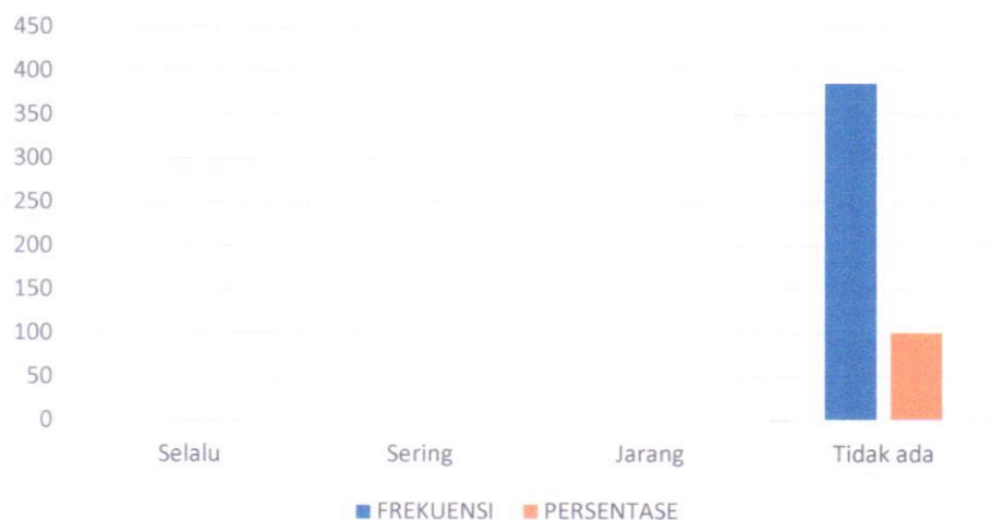
Indeks pada indikator Menjual Pengaruh