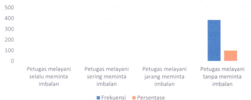
Indeks pada indikator Penyalahgunaan Jabatan